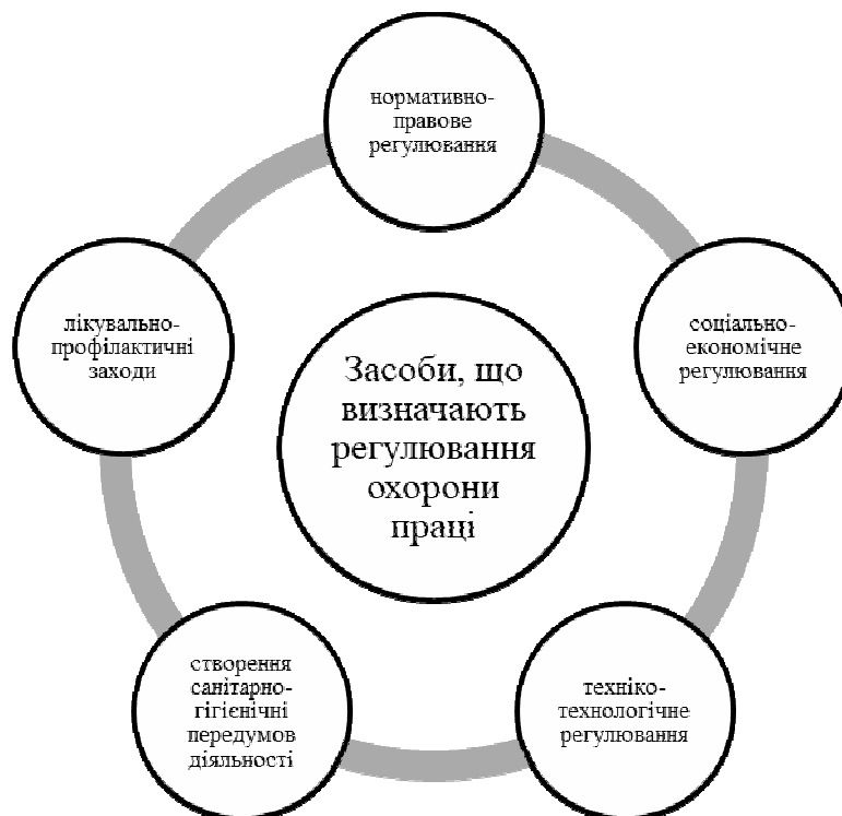
Рис. 1. Засоби, що визначають нормативно-правове регулювання охорони праці на підприємствах України

Виклад основного матеріалу. Охорона праці є питанням, що повинно не тільки формуватися всередині підприємства відповідно до етичних норм та сформованих людських цінностей, але й таким процесом, який регулюється на законодавчому рівні. Зокрема, в Законі України «Про охорону праці» встановлені наступні засоби, що визначають регулювання охорони праці і спрямовуються на те, щоб зберегти здоров'я, життя та працездатність персоналу при здійсненні трудової діяльності [7] (рис.1).