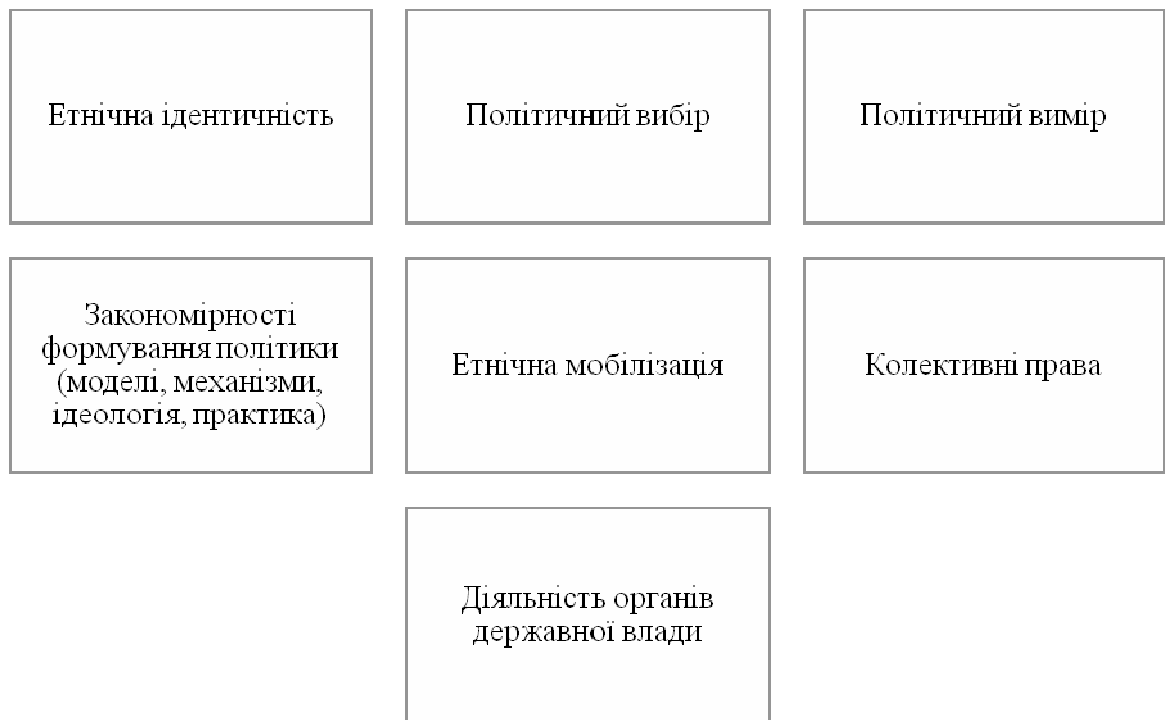
Рис. 1. Складові поняття «етнополітика»