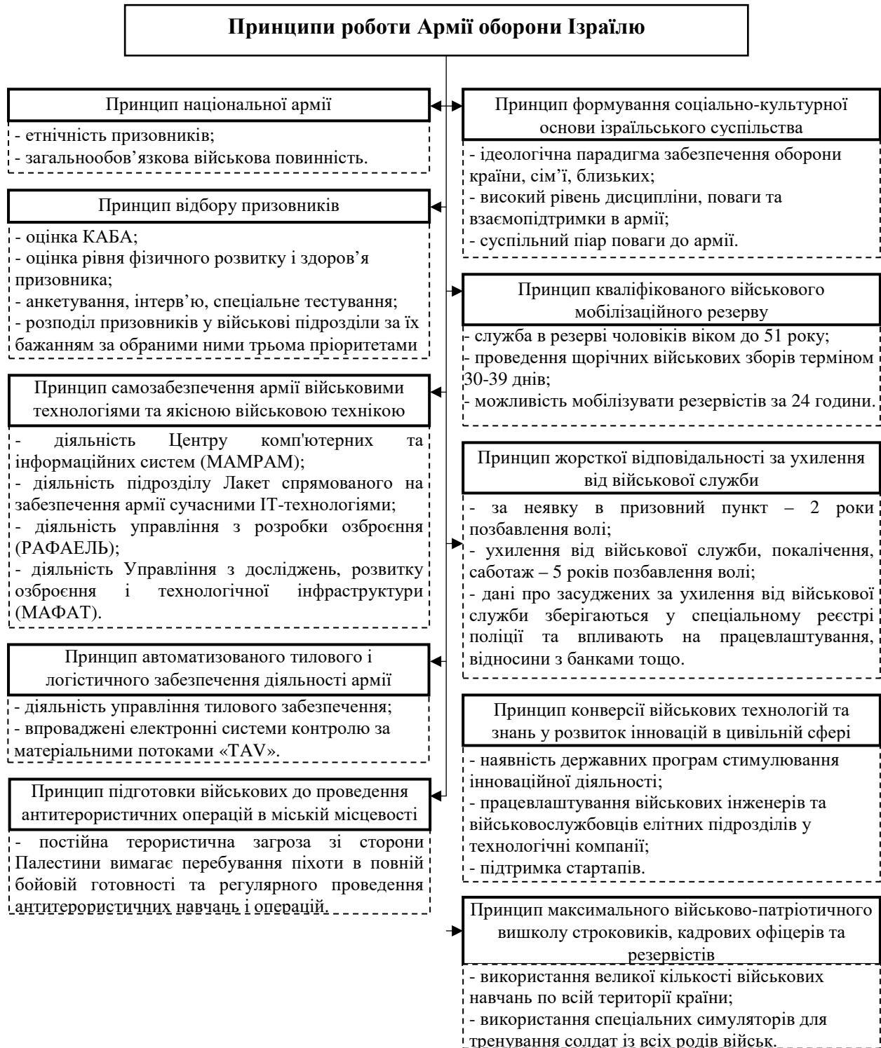
Рис. 2. Принципи роботи Армії оборони Ізраїлю

Безумовно, відновлення загальнообов'язкової військової повинності в Україні через низький рівень довіри до владних інституцій викличе спротив населення, однак довіра до Збройних сил України (рис. 3), сьогодні, перебуває на досить високому рівні, що сприятиме виконанню цього завдання.