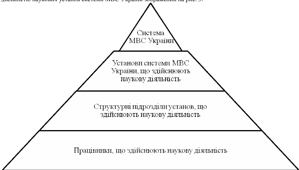
Рис. 3. Ієрархічний підхід до класифікації суб'єктів механізму державного управління науковою діяльністю наукових установ системи МВС України

системи МВС України, доцільно розглядати ієрархічний підхід, який полягає у певній, визначеній підпорядкованості та відповідальності. Ієрархічний підхід до класифікації суб'єктів механізму державного управління науковою діяльністю наукових установ системи МВС України зображений на рис. 3.