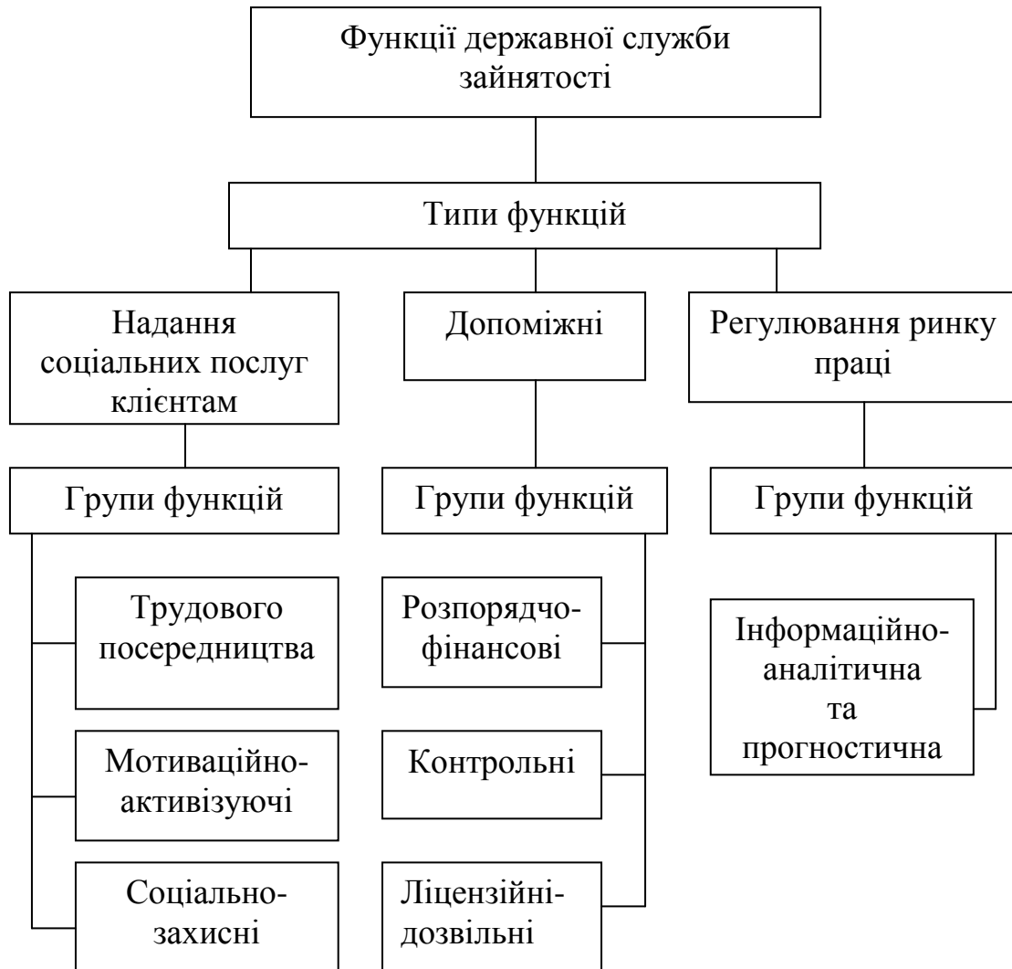
Рис. 2. Функції державної служби зайнятості