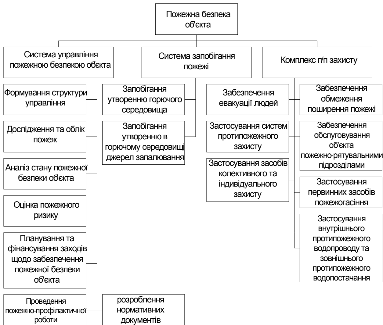
Рис. 2 Структурна схема пожежної безпеки об'єкта

Це, у свою чергу, дозволяє запропонувати визначення організаційно-правового механізму державного управління пожежною безпекою як діяльності публічних інституцій, які діють на основі конституційно-правових норм та створені з метою вироблення та реалізації державної політики пожежної безпеки, щодо забезпечення неприпустимого ризику виникнення і розвитку пожеж, попередження та подолання можливості завдання шкоди живим істотам, матеріальним цінностям та довкіллю.