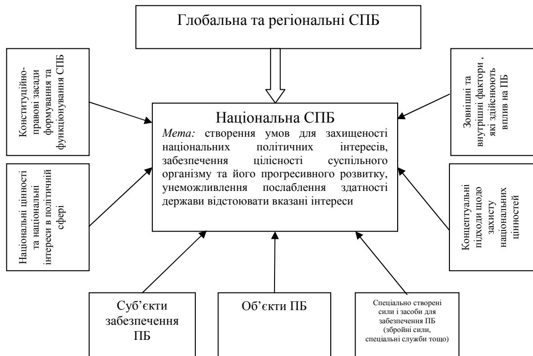
Рис. 1. Основні компоненти, що визначають мету, організаційно-функціональну структуру та пріоритетні функції СПБ.

Головною метою СПБ є створення умов для захищеності національних політичних інтересів, забезпечення цілісності суспільного організму та його прогресивного розвитку, унеможливлення послаблення здатності держави відстоювати вказані інтереси.