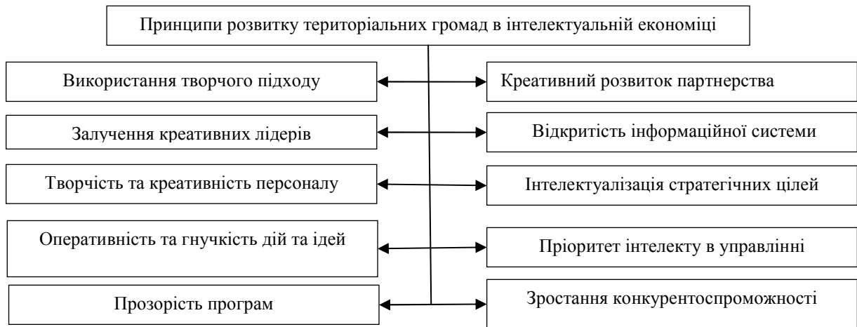
Рис. 2. Основні принципи розвитку територіальних громад в умовах інтелектуалізації економіки

1. Застосування системного всебічного та комплексного підходу до інтелектуального розвитку територіальної громади. Економічний розвиток повинен бути багатоплановим і цілеспрямованим на вирішення питань, пов'язаних із забезпеченням сталого розвитку громади та збалансуванням економічних, соціальних і природоохоронних завдань.