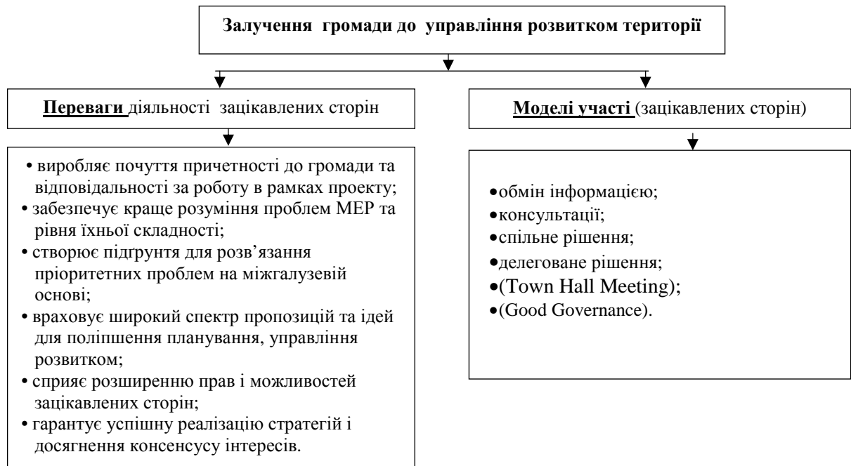
Рис. 4. Участь громади в управлінні розвитком території

Колективна участь в управлінні місцевим розвитком – це добре організована система постійного залучення зацікавлених сторін, яка складається з низки заходів – від опитувань, фокусгруп, форумів тощо до координаційних комітетів, робочих груп, колегій і консультативних рад, до яких входять зацікавлені сторони.