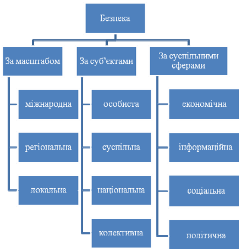
Рис. 1. Класифікаційна ознака поняття "безпека"

різні типи безпеки. Виходячи з цього пропонуємо розглянути дану класифікацію, ми вважаємо, що даний крок дозволить нам краще з'ясувати сутність економічної безпеки (рис. 1).