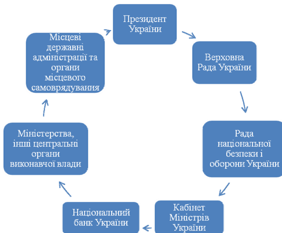
Рис. 2. Основні суб'єкти, які врегульовують питання економічної безпеки в Україні

• Зважаючи на вищезазначене варто відмітити, що такий спектр, який охоплює категорійне поняття “безпека” повинно бути врегульованим на законодавчому рівні, оскільки саме воно відіграє важливу роль в житті країни, а саме в економічному плані. В Україні економічна безпека врегульовується нормативними та законодавчими актами, окрім цього існують певні суб'єкти, котрі стежать та беруть безпосередню участь у врегулюванні питання, що стосується економічної безпеки України. Ми пропонуємо розглянути та визначити основні повноваження, якими наділені суб'єкти, які врегульовують питання економічної безпеки в Україні (рис. 2).