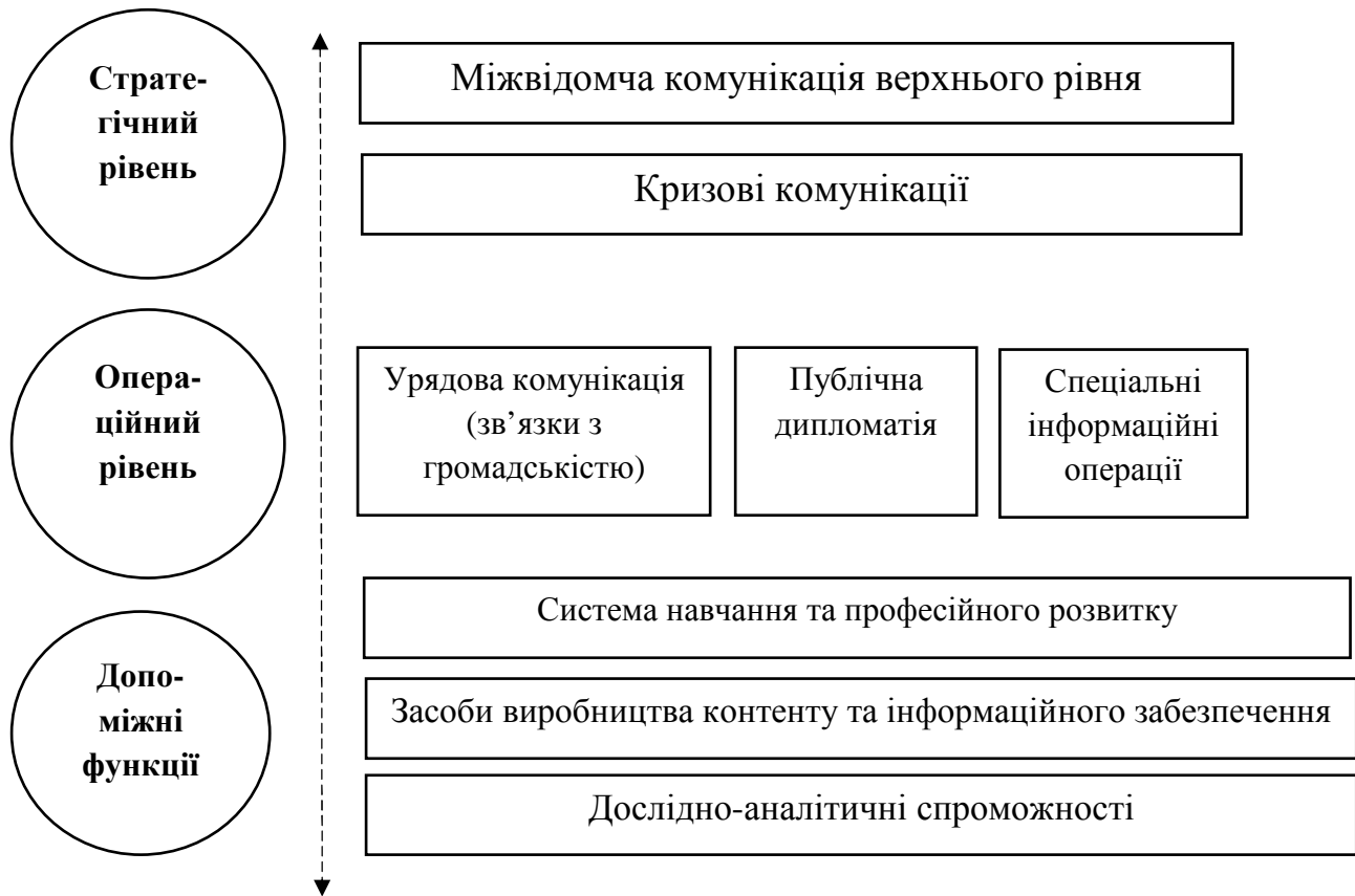
Рис. 2. Структура державної системи стратегічних комунікацій, запропонована Міністерством інформаційної політики України (2016 р.)

Варто зазначити, що Україна почала здійснювати лише перші кроки до впровадження у практику державного управління принципів стратегічних комунікацій. Часто це супроводжувалося неусвідомленістю величини проблеми, хибними уявленнями та поверхневими знаннями. Розпочавши цей процес у 2014 році, новостворене Міністерство інформаційної політики України запропонувало таку структуру державної системи стратегічних комунікацій (Рис. 2) [12].