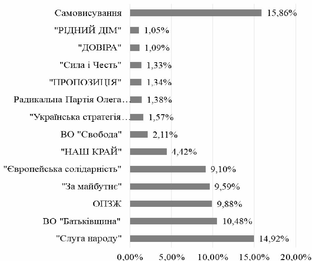
Рис. 2. Політичні партії в місцевих радах за підсумками виборів в 2020 р.