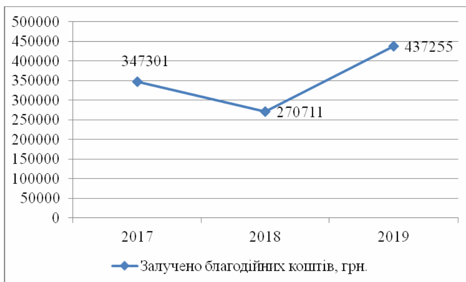
Рис. 1. Динаміка залучення благодійних коштів на розвиток дошкільної освіти в м. Сарни Рівненської області

Незважаючи на значні бюджетні інвестиції органів місцевого самоврядування в розвиток дошкільної освіти, все ж існує потреба в благодійних та спонсорських фінансових ресурсах. За досліджуваний період благодійниками, батьками було залучено понад 1 млн. грн. (рис. 1).