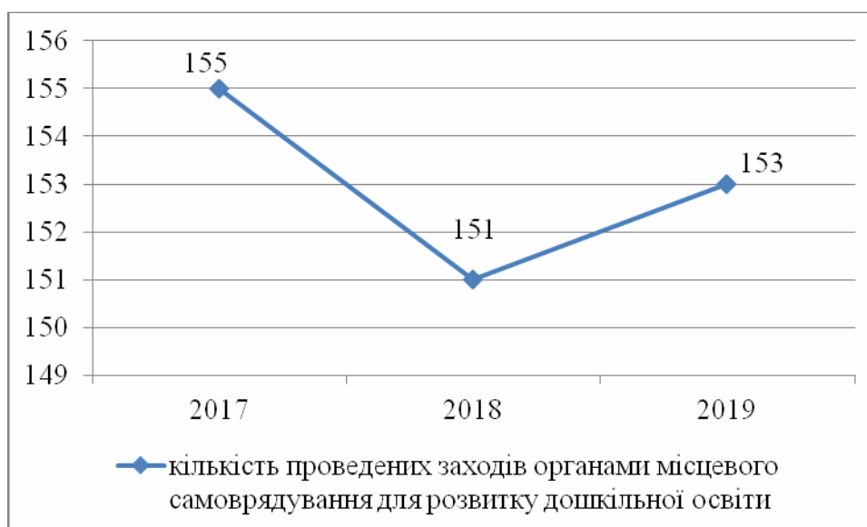
Рис. 3. Динаміка заходів, проведених органами місцевого самоврядування м. Сарни Рівненської області для розвитку дошкільної освіти

Зважаючи на вищенаведене, органи місцевого самоврядування щорічно проводять різні заходи, спрямовані стимулювати дошкільні заклади до надання якісних навчально-виховних послуг. Кількість заходів, проведених на підтримку дошкільної освіти є різною в різні періоди, але ж все рівно свідчить про те, що місцева влада намагається створити комфортні умови для забезпечення якісними послугами дошкільнят.