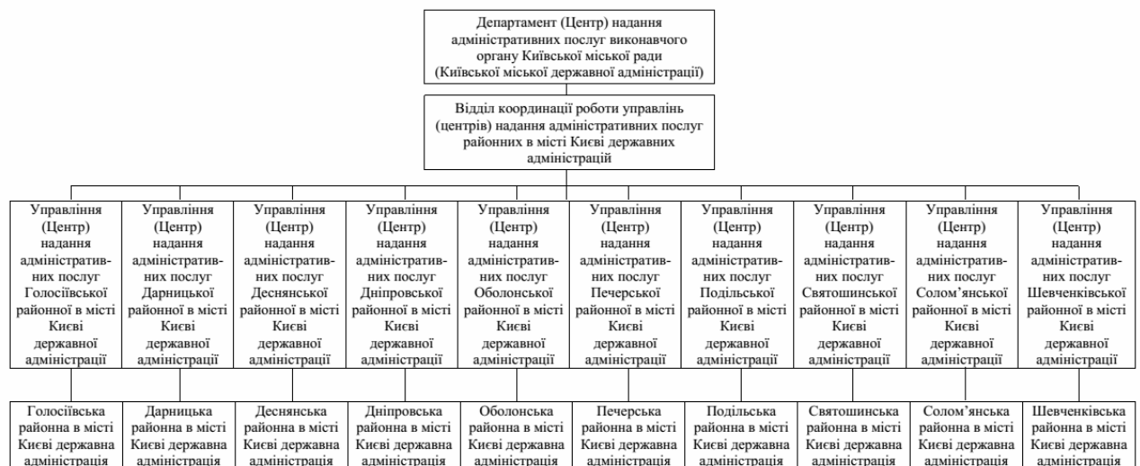
Рис. 2. Схема управління системою надання адміністративних послуг у місті Києві

У вирішенні питання інституційного становлення системи управління сферою надання адміністративних послуг найбільш ефективною є наступна схема (Рис.2):