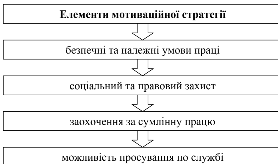
Рис. 2. Елементи мотиваційної стратегії органу публічної влади

Мотиваційна стратегія, що виступає ефективним засобом управління людськими ресурсами на публічній службі, полягає у визначенні індивідуальних потреб і створенні відповідного робочого середовища для їх задоволення. Мотиваційній стратегії притаманні відповідні мотиваційні елементи, що представлені на рисунку 2.