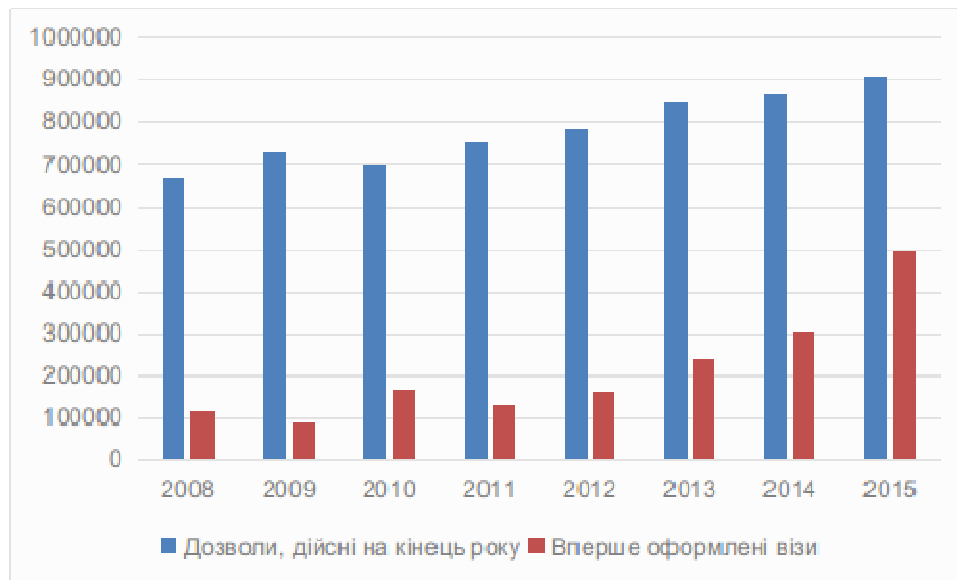
Рис. 1. Чисельність вперше оформлених та чинних на кінець року дозволів на перебування громадян України в країнах ЄС, 2008-2015 рр. [згідно даних Eurostat: Asylum and Managed Migration][14]

вони частіше відчувати в собі дискримінацію з боку роботодавців та суспільства в цілому. У міру того, як Україна перетворюється на країну мігрантів, постають основні задачі щодо забезпечення прав та свобод новоприбулих українських мігрантів до інших країн. Більша частина українських мігрантів не знають ні мови, ні культури, але варто зауважити, що стаціонарні мігранти, на відміну від трудових мігрантів, мають базові знання про країну, культуру, побут та мову. Європейський союз закликає Україну розробити комплексну програму міграційної політики, щодо українських мігрантів, основним виданого співробітництві країн ЄС та України є зацікавленість у зміцненні кордонів та запобіганню нелегальної міграції. Розмежування міграційної політики в напрямку стаціонарних та трудових мігрантів має бути закріплено, як на законодавчому рівні, так і за допомогою двосторонніх та багатосторонніх міжнародних договорів з іншими країнами [9].